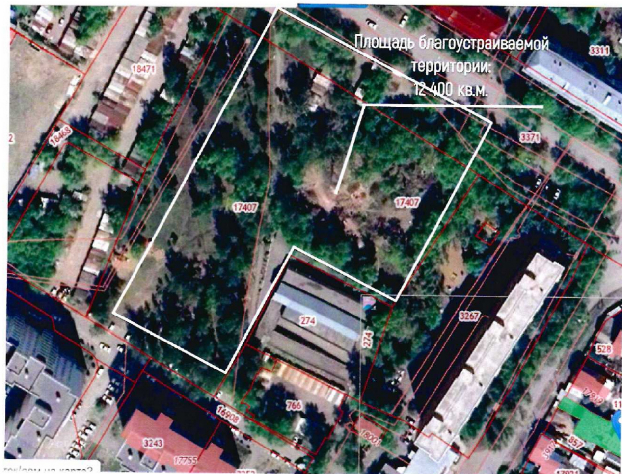
Схема границ благоустройства территории. Описание границ: территория под благоустройство расположена в кадастровом квартале: 55:36:070105:17407