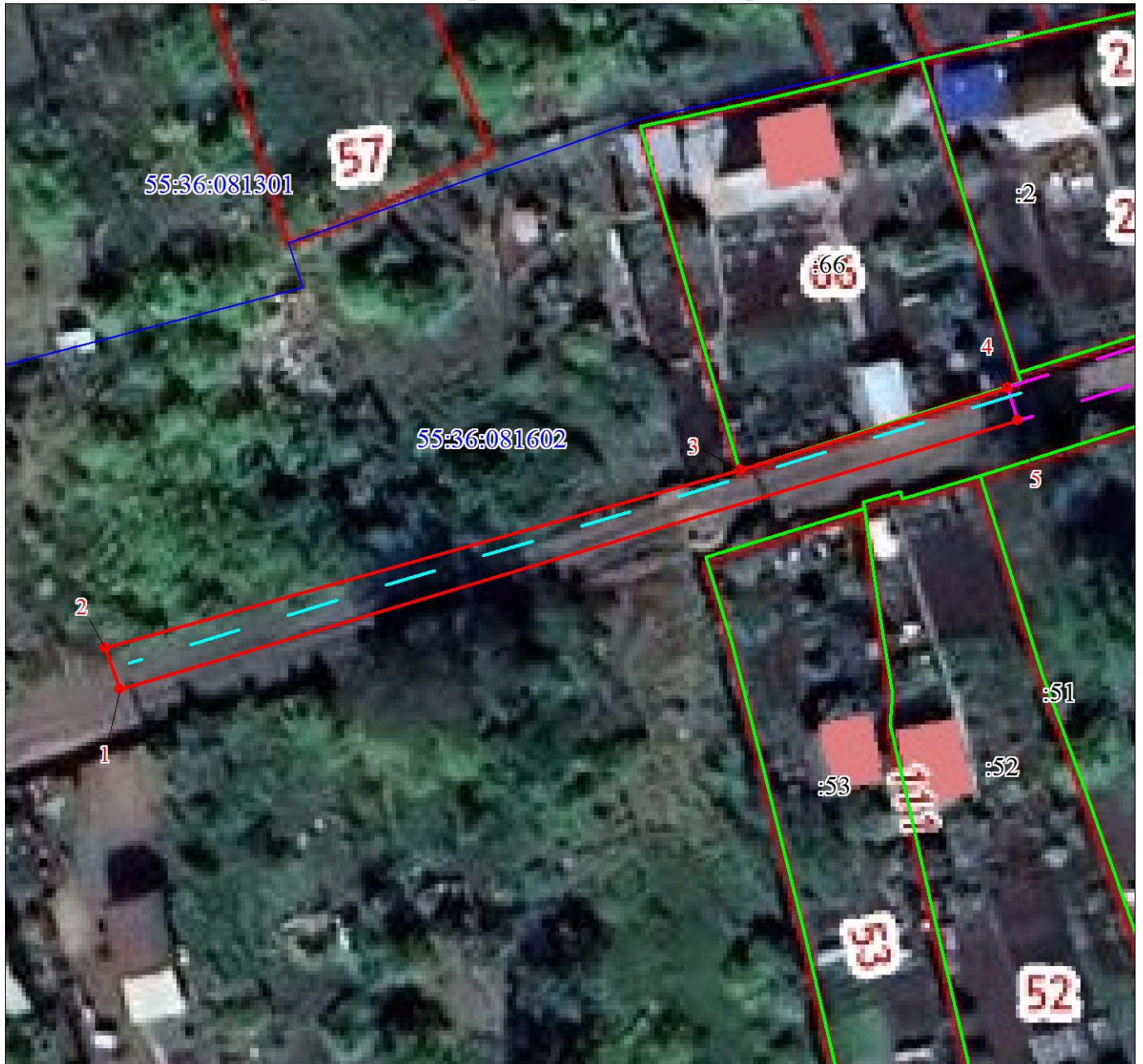
СХЕМА расположения границ публичного сервитута