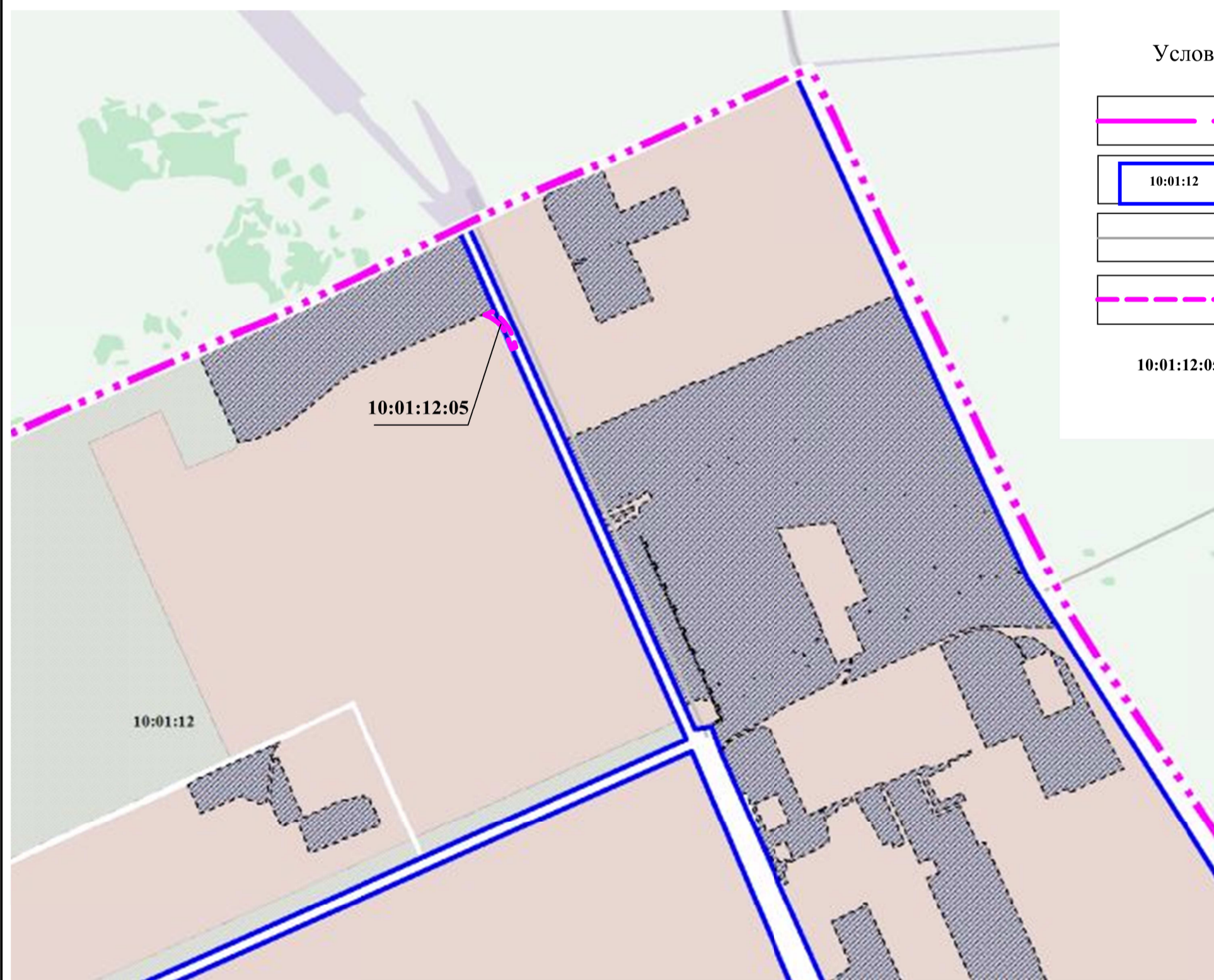
Схема расположения границ проектирования и элементов планировочной структуры