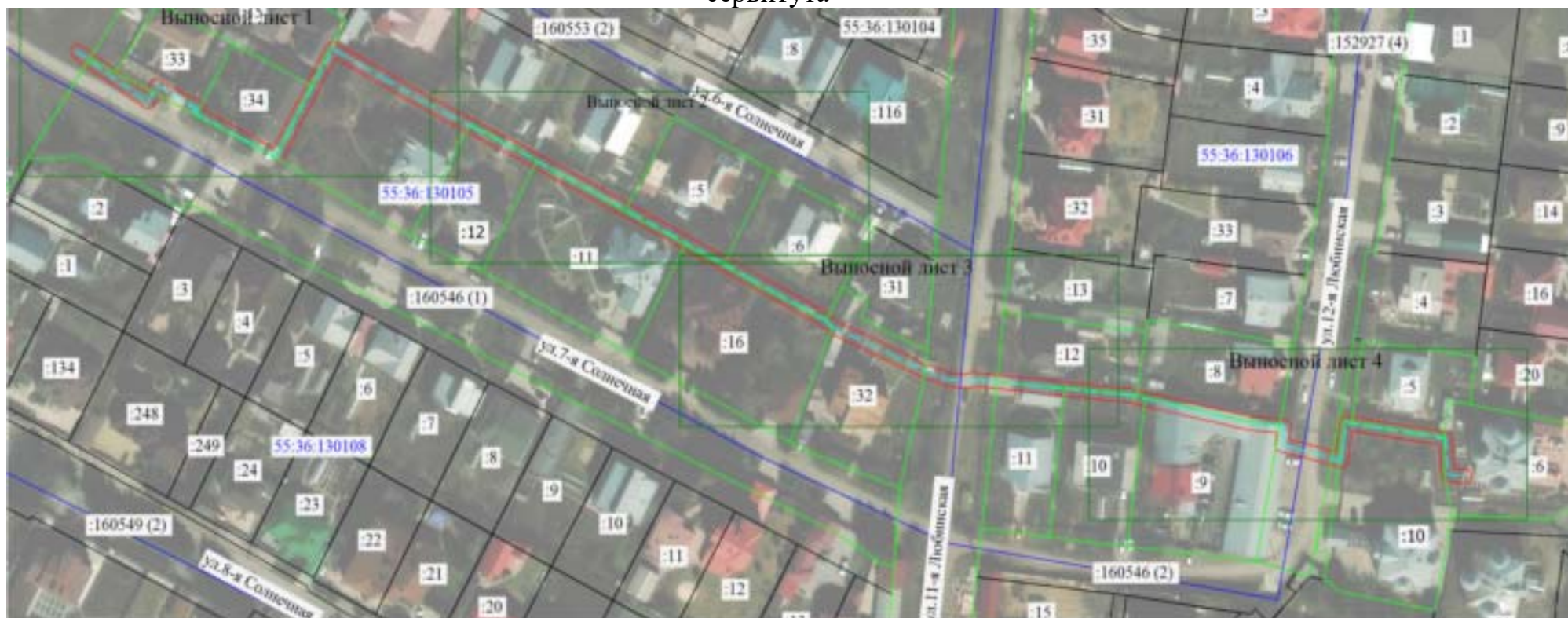
СХЕМА расположения границ публичного сервитута