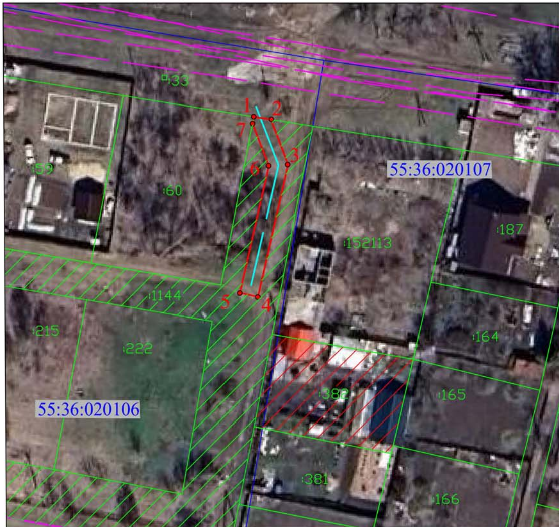
СХЕМА расположения границ публичного сервитута