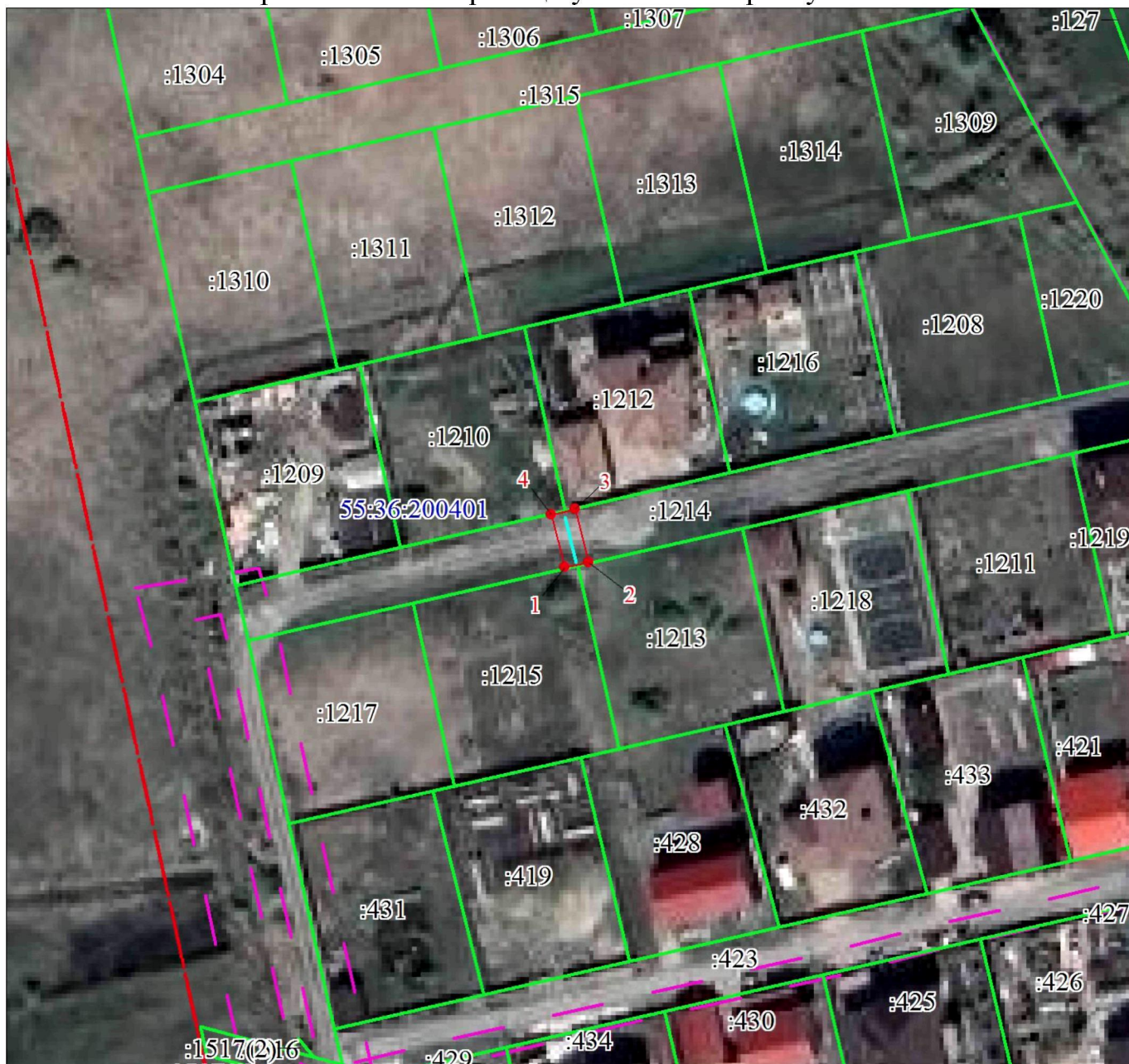
СХЕМА расположения границ публичного сервитута