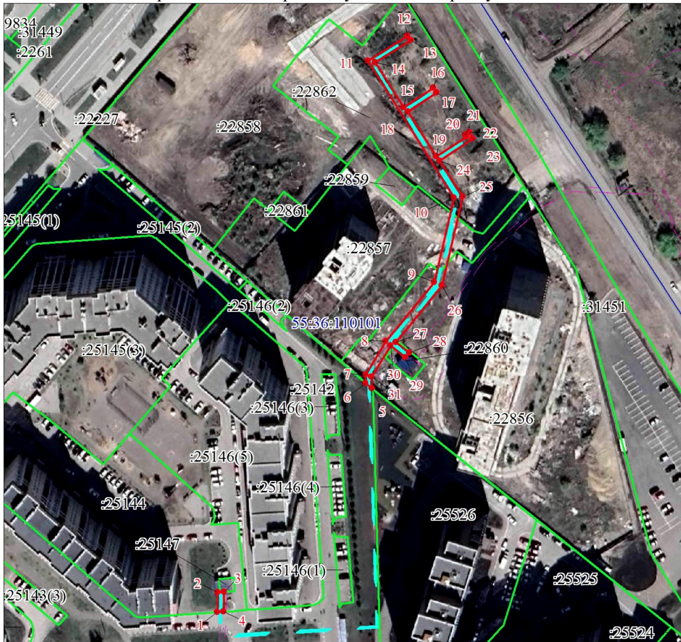
СХЕМА расположения границ публичного сервитута