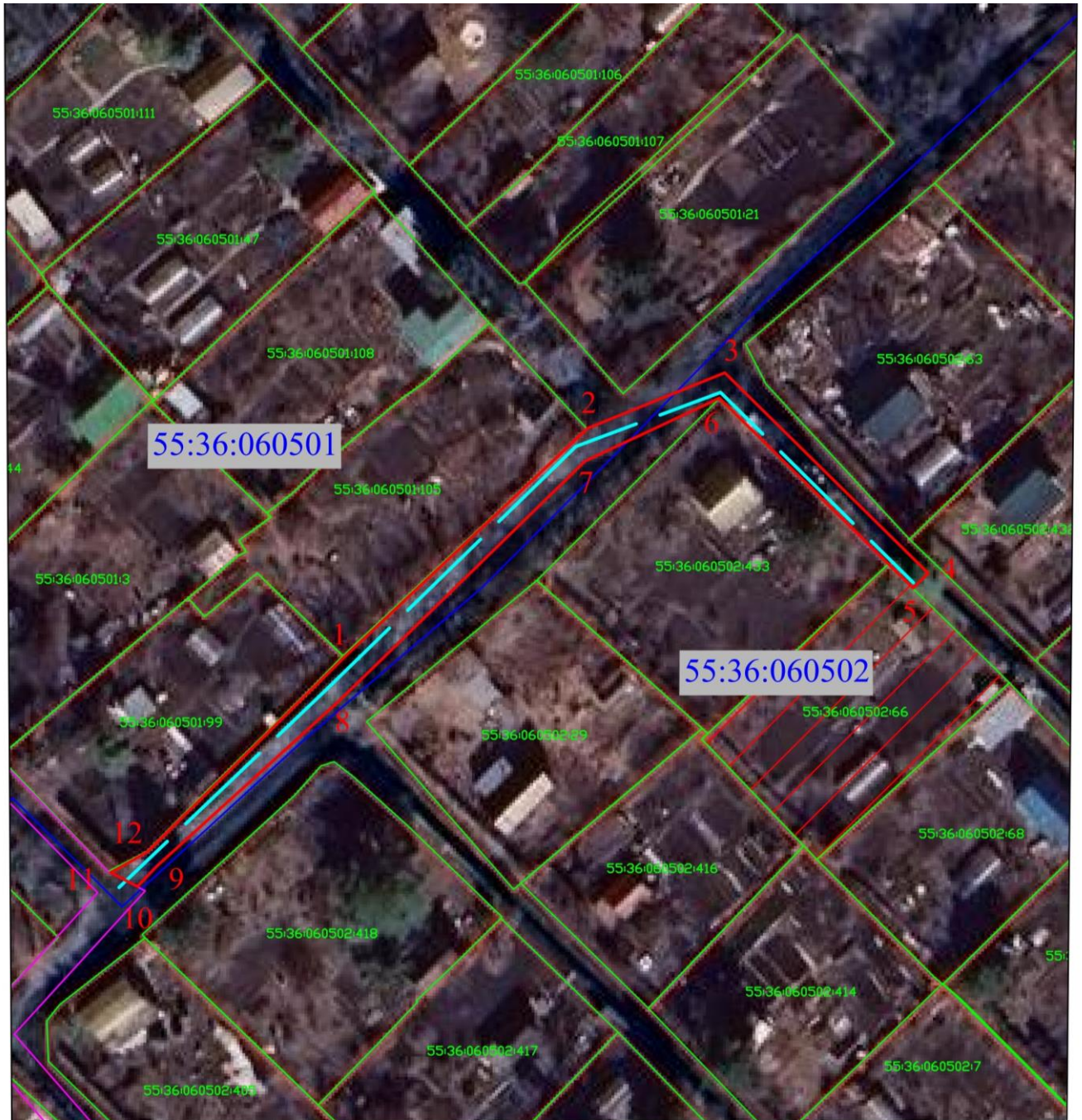
СХЕМА расположения границ публичного сервитута