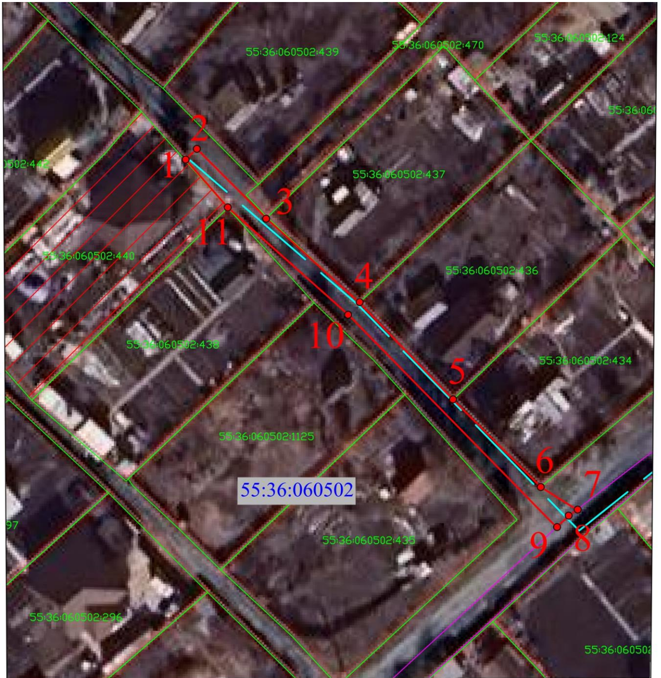
СХЕМА расположения границ публичного сервитута