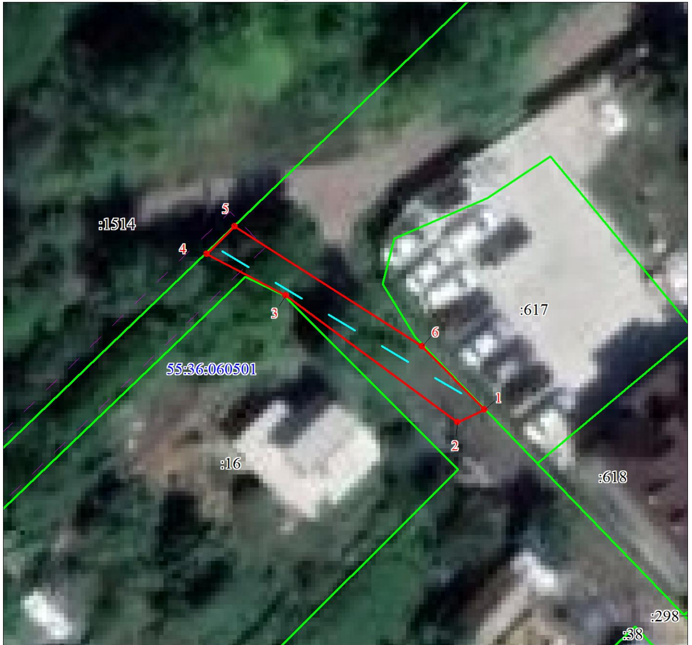
СХЕМА расположения границ публичного сервитута