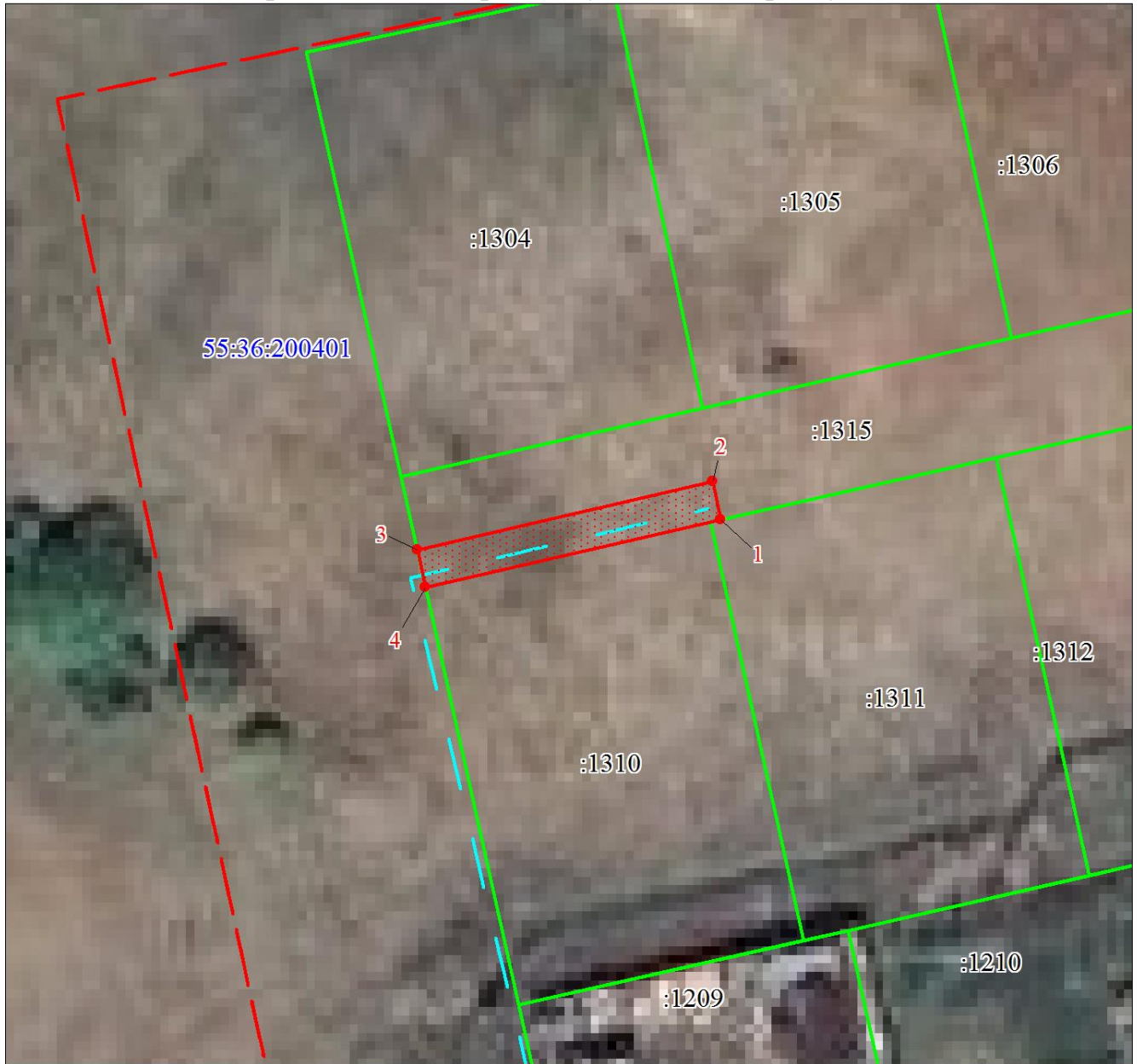
СХЕМА расположения границ публичного сервитута