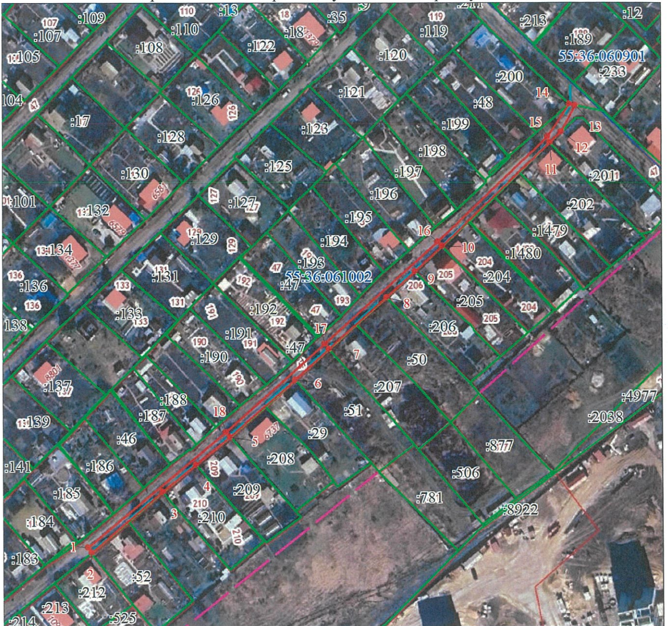
СХЕМА расположения границ публичного сервитута