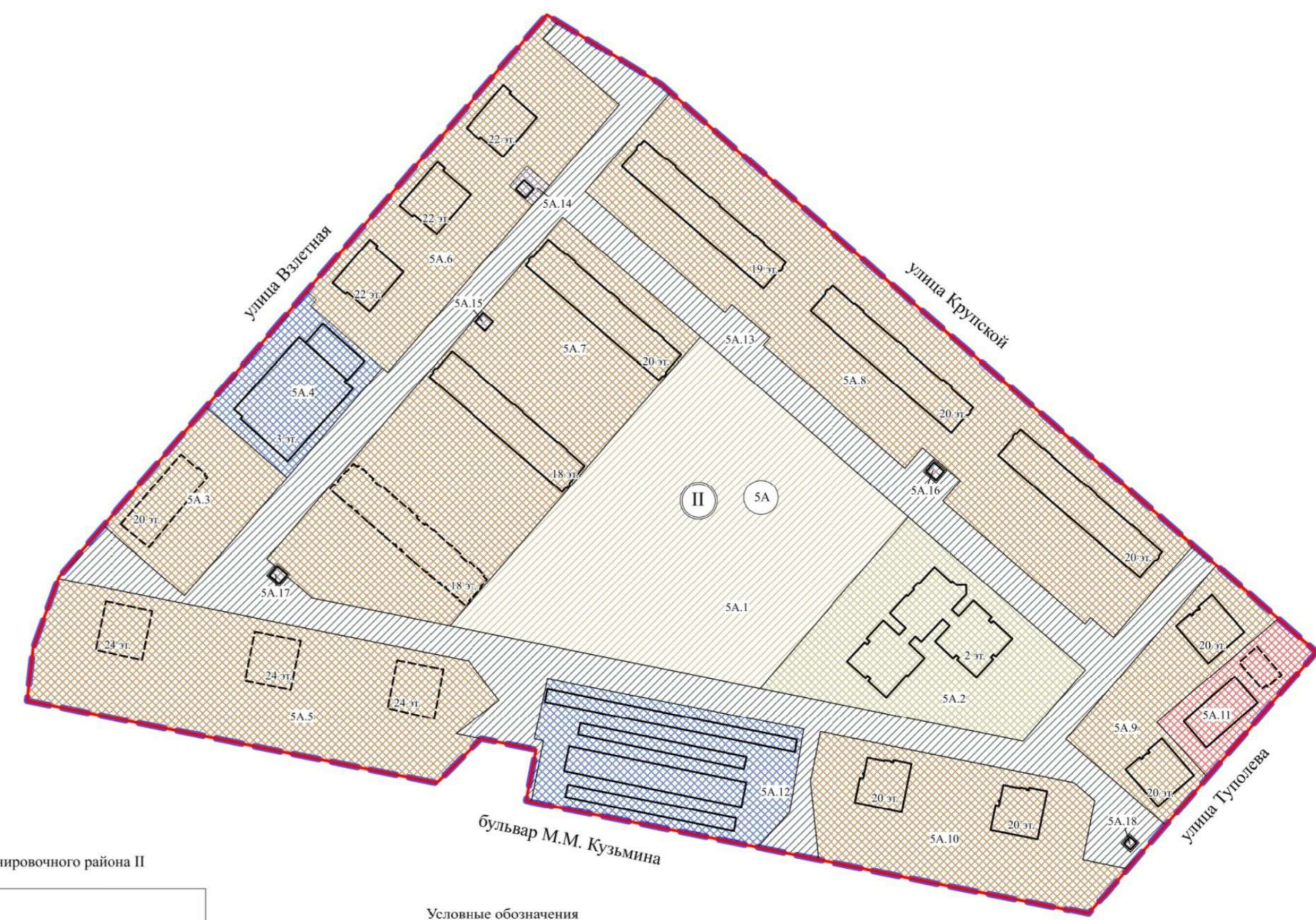
Экспликация зон элемента планировочной структуры 5А планировочного района II