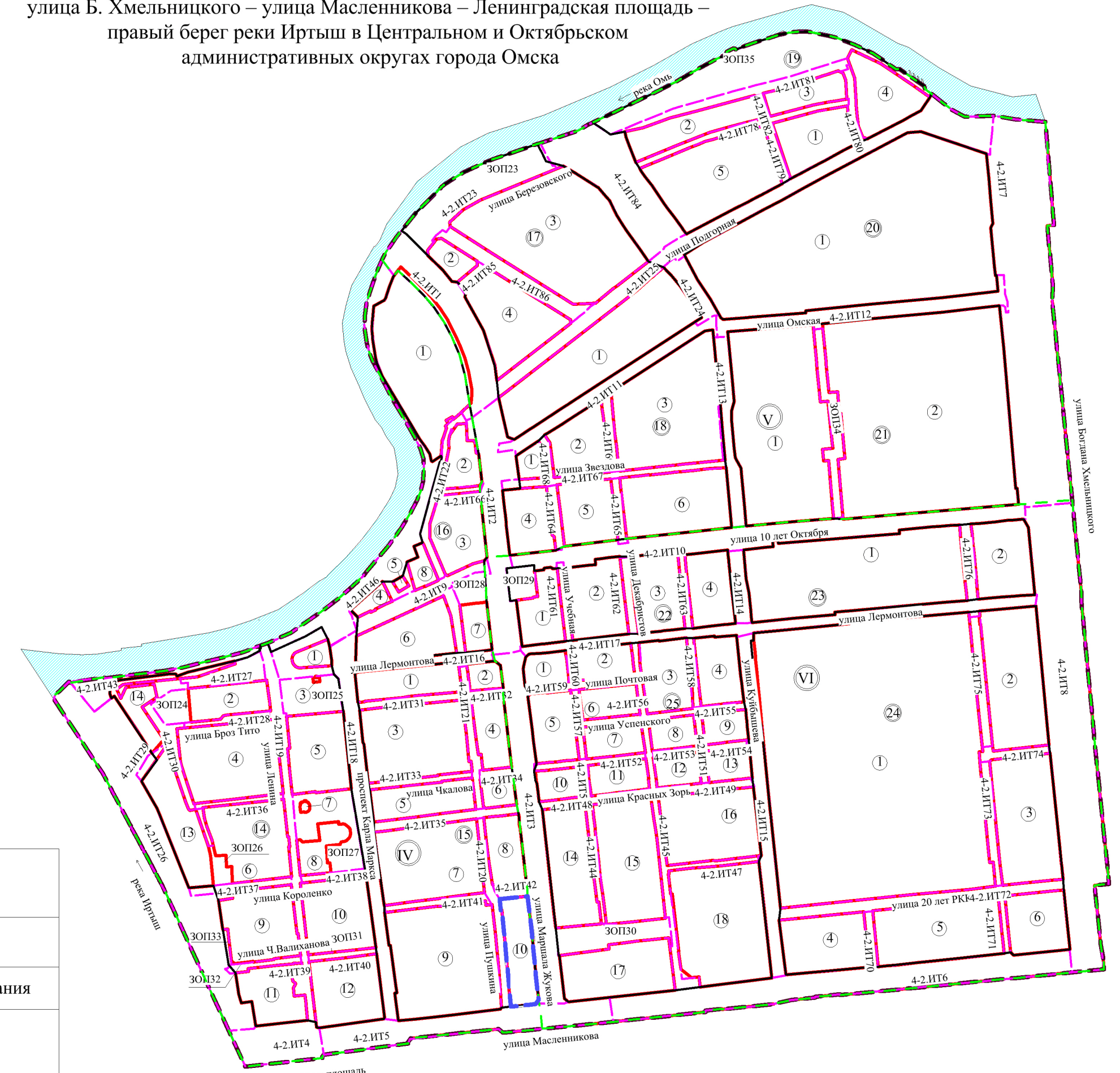
Схема расположения границ проектирования и элементов планировочной структуры проекта планировки территории, расположенной в границах: левый берег реки Оми – улица Б. Хмельницкого – улица Масленникова – Ленинградская площадь – правый берег реки Иртыш в Центральном и Октябрьском административных округах города Омска